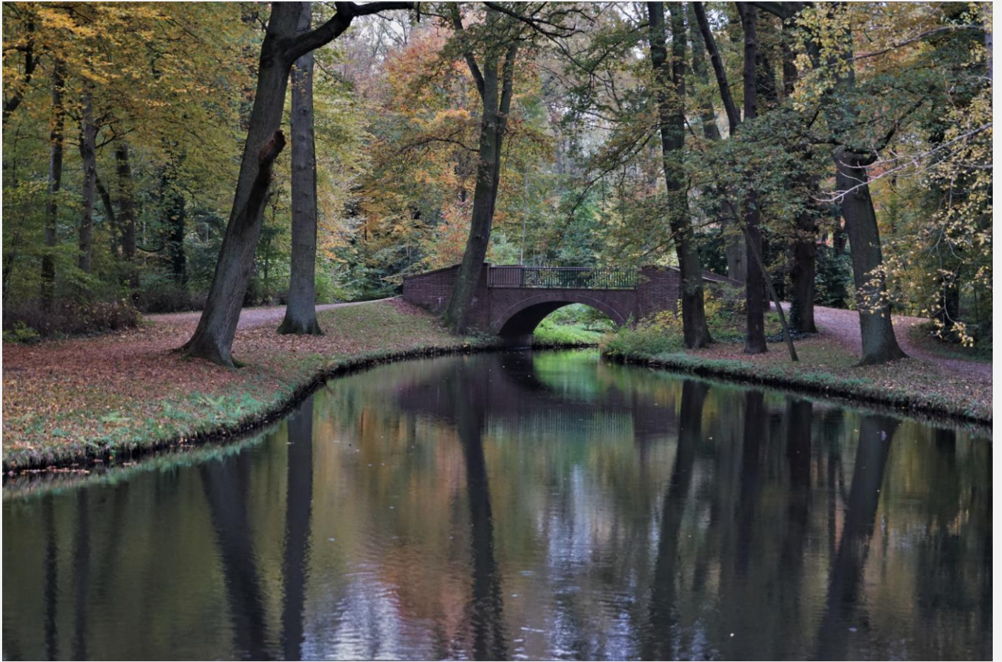
Alfred-Hoffmann-Brücke aus der Jahrhundertwende