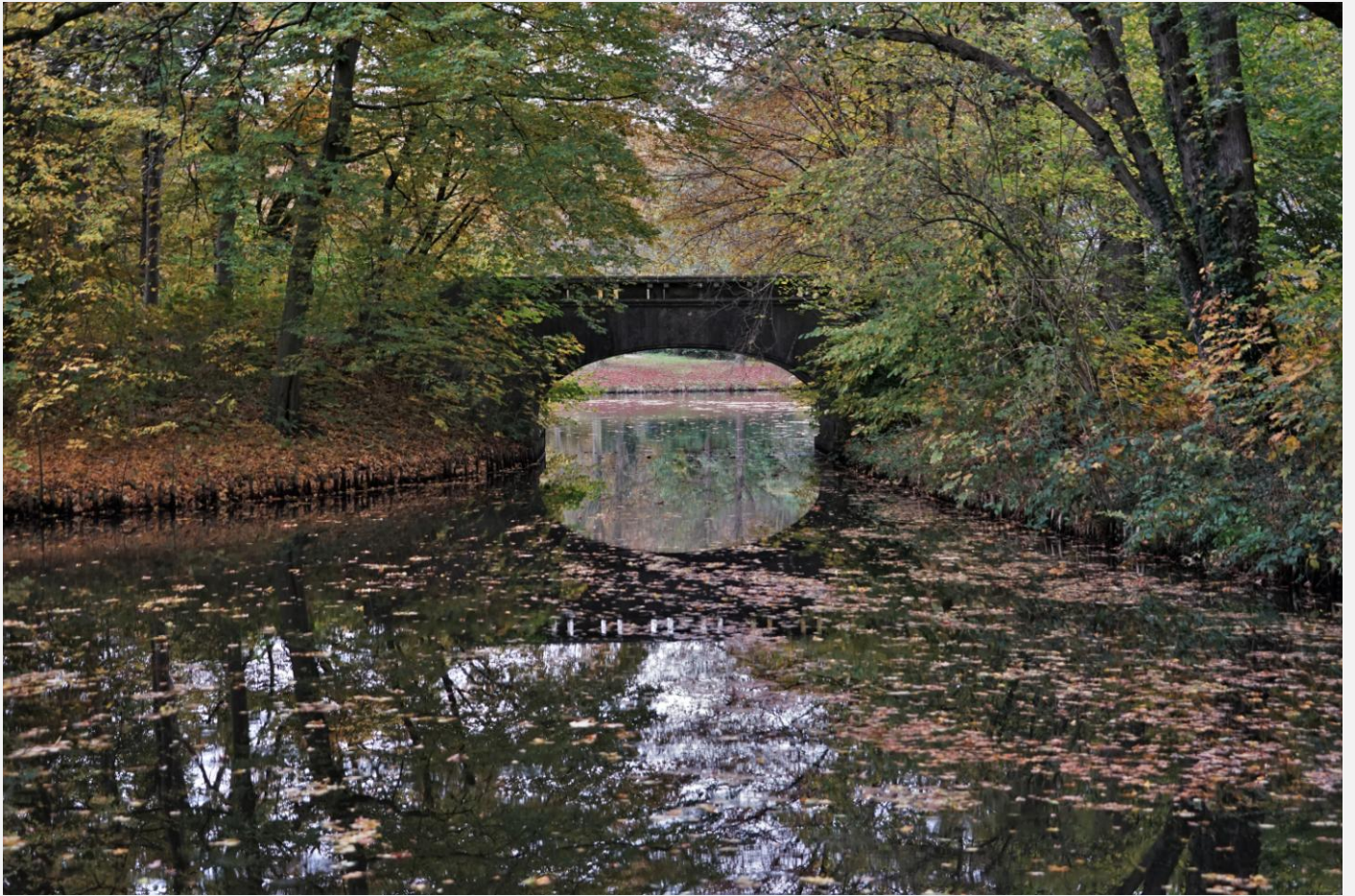
Lambert-Leisewitz-Brücke von 1912