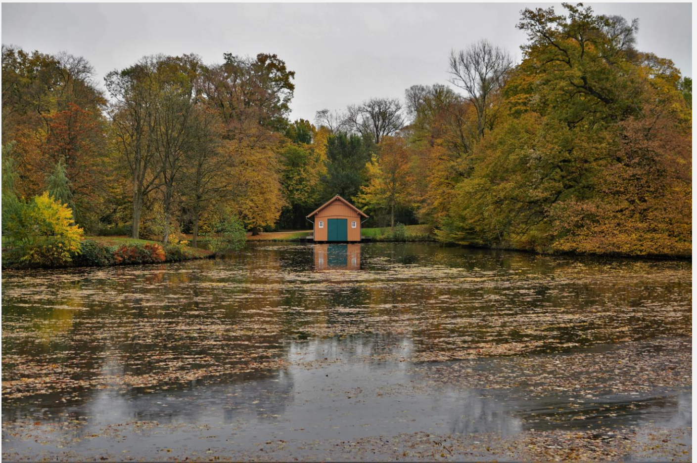
Bootshaus MARIE am Meiereisee